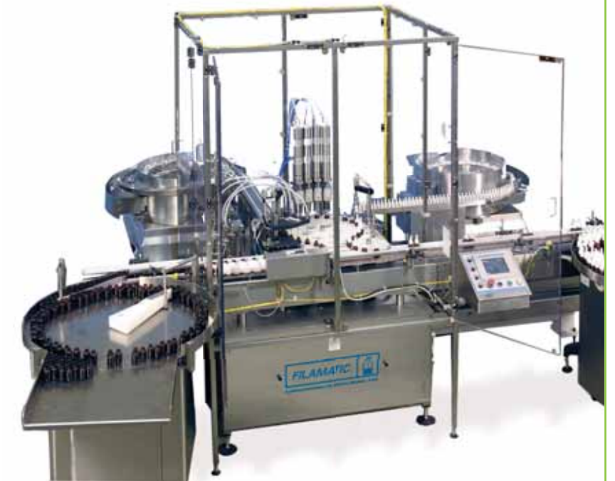
MNB XT De Alta Velocidad Una version de la MNB-2000 con mayor velocidad

Filamatic le proporcionará apoyo antes, durante, y después de la venta. Nuestro grupo de ingenieros técnicos de alta experiencia, identificarán la máquina ideal para la solución más favorable para su aplicación. Nuestro grupo de administración de proyectos designará una persona de contacto desde el principio hasta el final de su proyecto. Nuestros departamentos de técnicos especialistas, y de servicio al cliente, le proporcionarán un apoyo excelente por mucho tiempo hasta después de la venta.