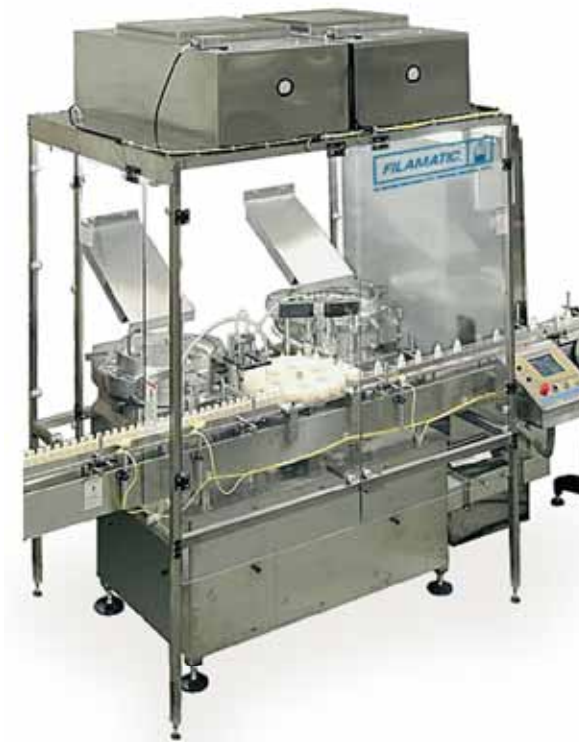
MNB 2000 Sistema completo de llenado / terminado en sistemas de empacados