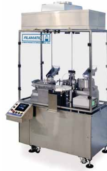
Mini-Monobloc Ideal para tandas pequeñas de producción